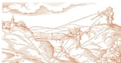
Coordinamento liberi professionisti di Nembro

n. 4 dall' Ordine degli Architetti di Bergamo