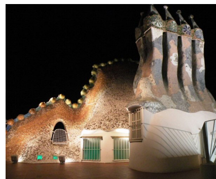
Barcellona - Casa Batlló - G. Santoro 2008