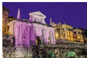
Porta San Giacomo in rosa

La corsa raggiungerà Bergamo il 21 maggio: i corridori passeranno da Città Alta, il traguardo della 15ª tappa sul Sentierone NORIS A PAGINA 28