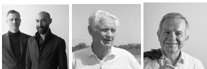
Iotti + Pavarani Architetti, Tassoni and Partners, Studio LSA PARCO ARENA CAMPOVOLO, PEDESTRIAN BRIDGE E MASTERPLAN PARCO DELLO SPORT DI REGGIO EMILIA