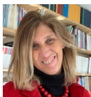
Alessandra Boccalari - Presidente Ordine degli Architetti di Bergamo