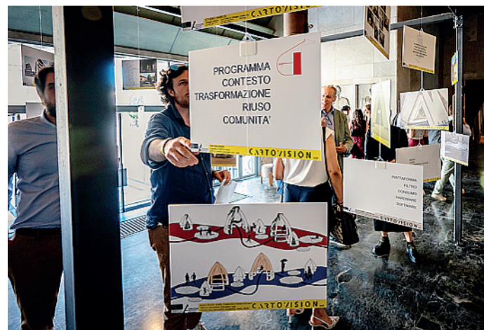
«Cartovision» a Palazzo della Libertà